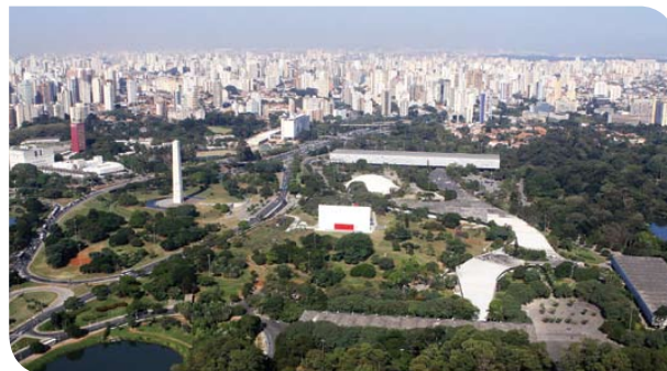
Parque Ibirapuera

Jabaquara, Conceição, São Judas, Saude, Praça da Árvore, Santa Cruz, Vila Mariana, Ana Rosa, Paraíso, Vergueiro e São Joaquim, Chácara Klabin, Santos-Imigrante, Alto do Ipiranga, Sacomã.