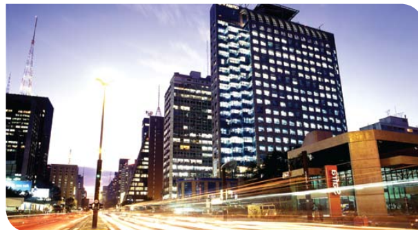
Avenida Paulista

Paraíso, Brigadeiro, Trianon-MASP, Consolação, Clínicas, Santuário N. Sra. de Fátima-Sumaré.