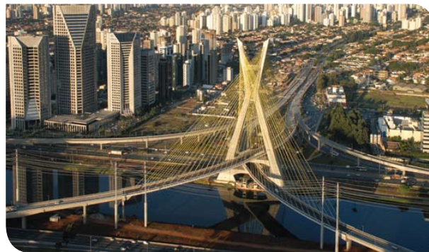
Ponte Octávio Frias de Oliveira

Granja Julieta, Morumbi, Berrini, Vila Olímpia, Cidade Jardim, Hebraica Rebouças