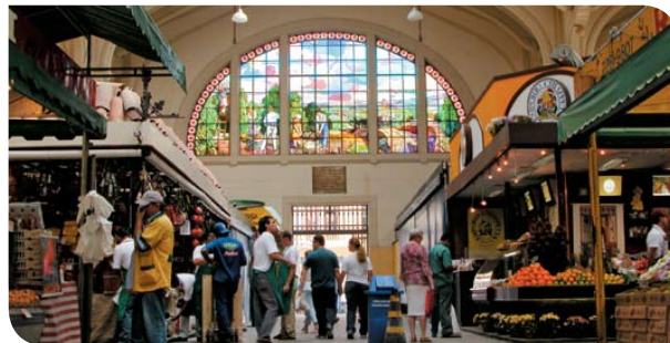
Mercado Municipal

Júlio Prestes, Luz, Brás, Mooca, Ipiranga, Água Branca, Lapa, Piqueri, Palmeiras-Barra Funda, Domingos de Moraes, Imperatriz Leopoldina, Ceasa.