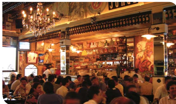
Bar na Vila Madalena

Vila Lobos - Jaguaré, Cidade Universitária, Pinheiros, Hebraica-Rebouças, Cidade Jardim, Vila Olímpia.